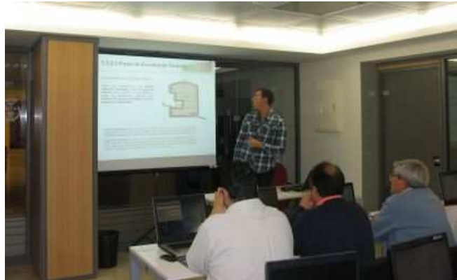
Curso Taller Tarificación Eléctrica de BT y Gas. 21, 22 y 23 enero.