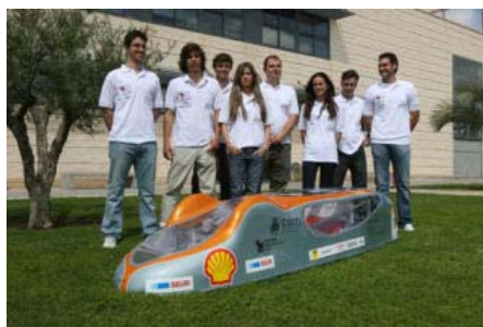
Los alumnos de la Universidad Miguel Hernández (UMH) de Elche que han diseñado un vehículo de motor de combustión denominado «Dátil 09»

Según la UMH, diez estudiantes de la Escuela Politécnica Superior (EPSE) han presentado hoy este coche, denominado "Dátil 09" y en el que han trabajado durante siete meses.