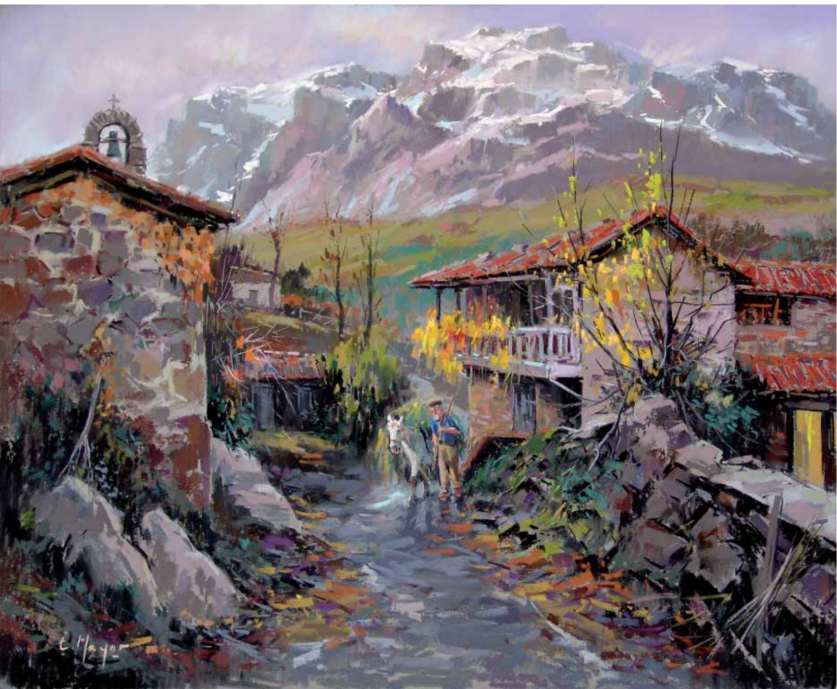
Picos de Europa Pastel — 100x60 cm