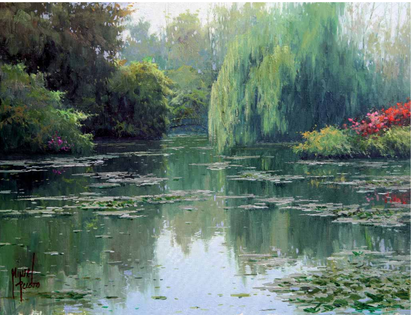
Estanque en Giverni (Francia)