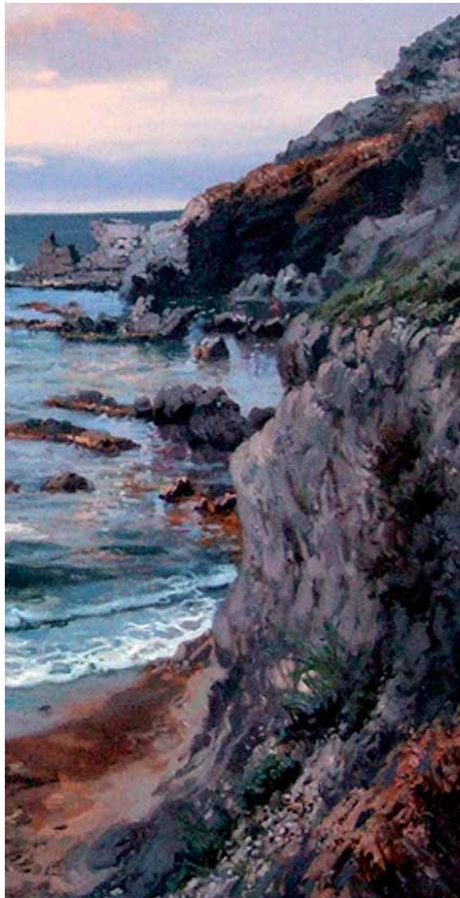
Algas en la arena. Cala Reona (Cartagena)