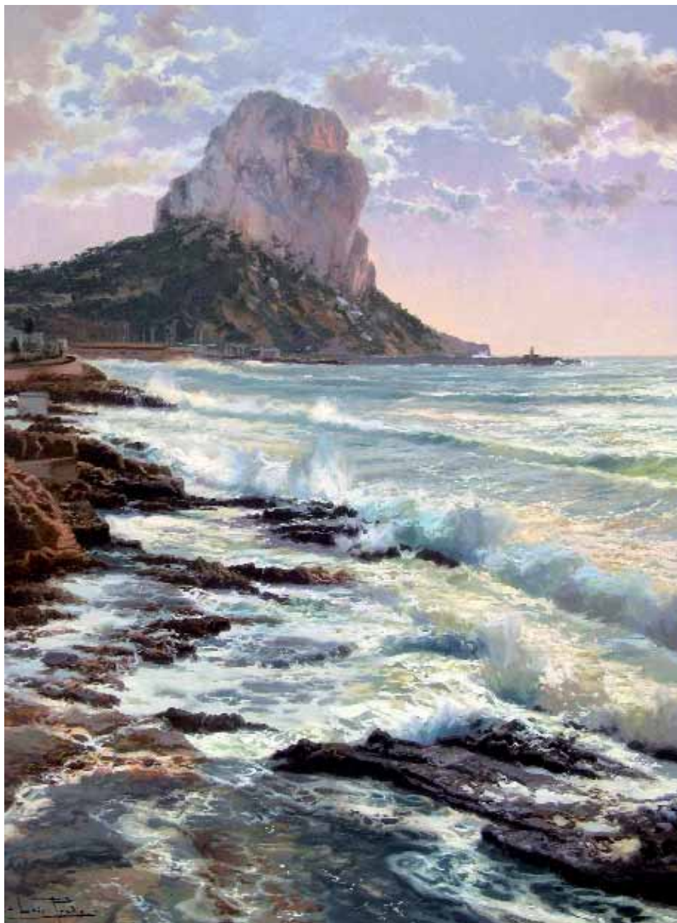
Siempre diferente Óleo s/lienzo — 81x60 cm