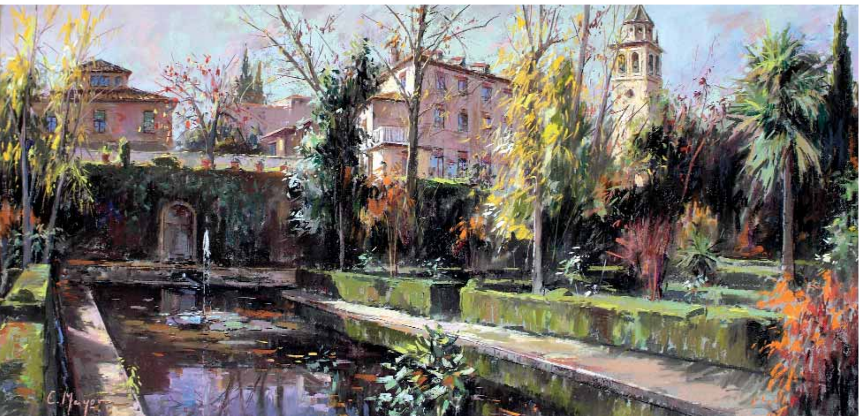
Jardines del Generalife