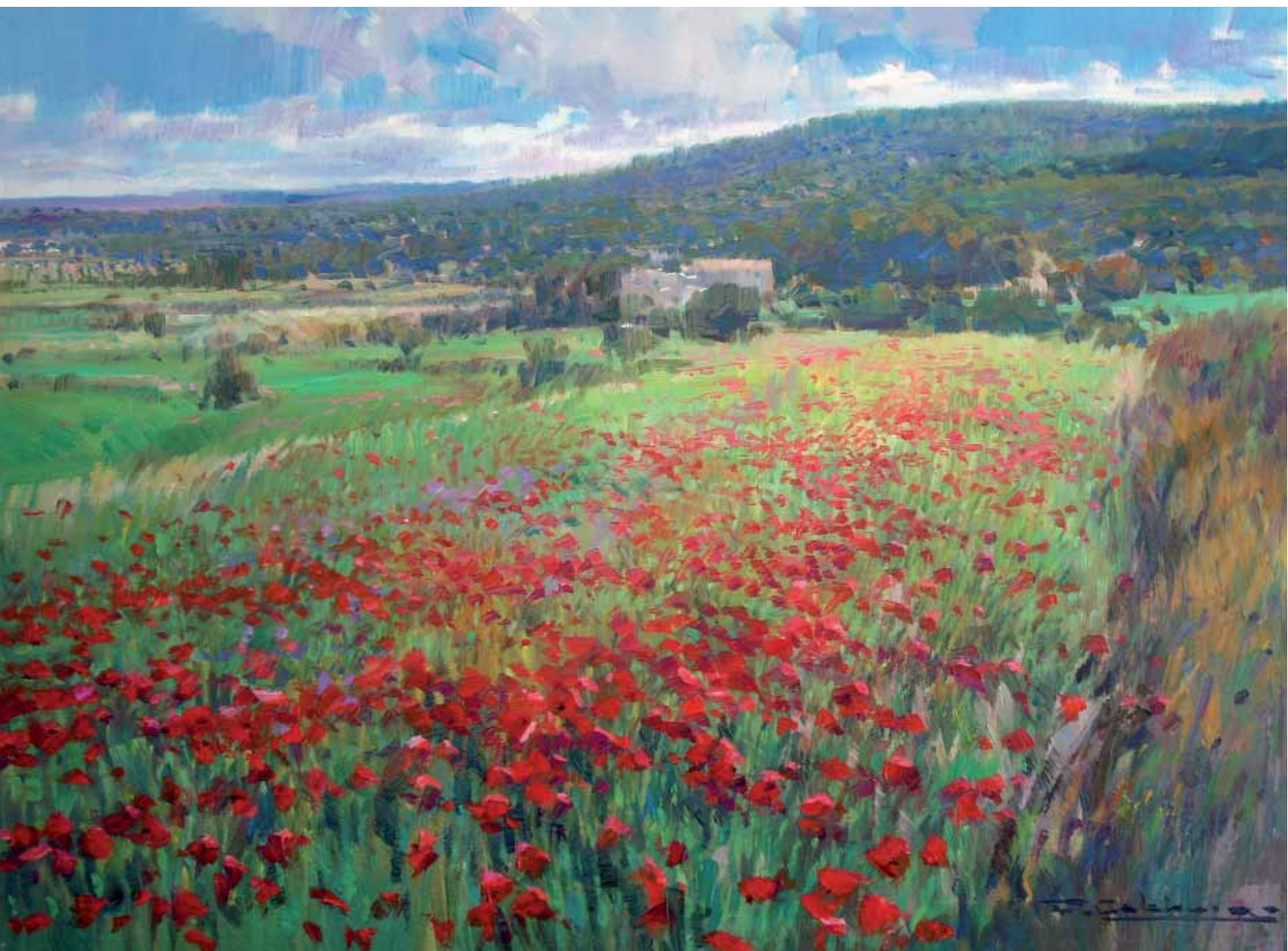
Paisaje con amapolas Óleo s/lienzo — 46x61 cm