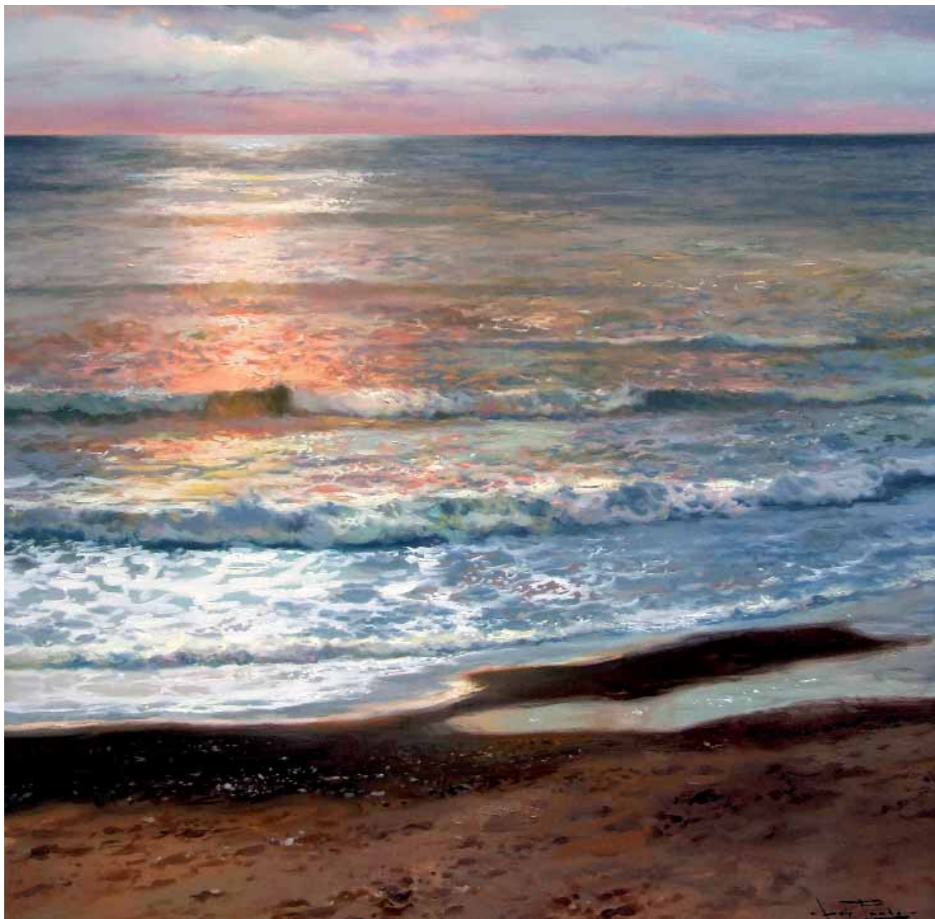
Despertar junto al mar. El Postiguet (Alicante)