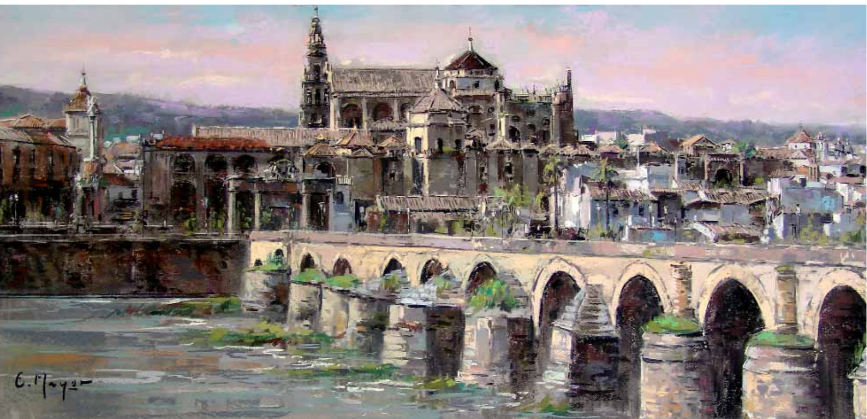
Córdoba Pastel — 81x45 cm.