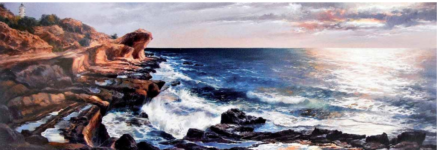
Despertando el cabo Óleo s/lienzo — 70x200 cm