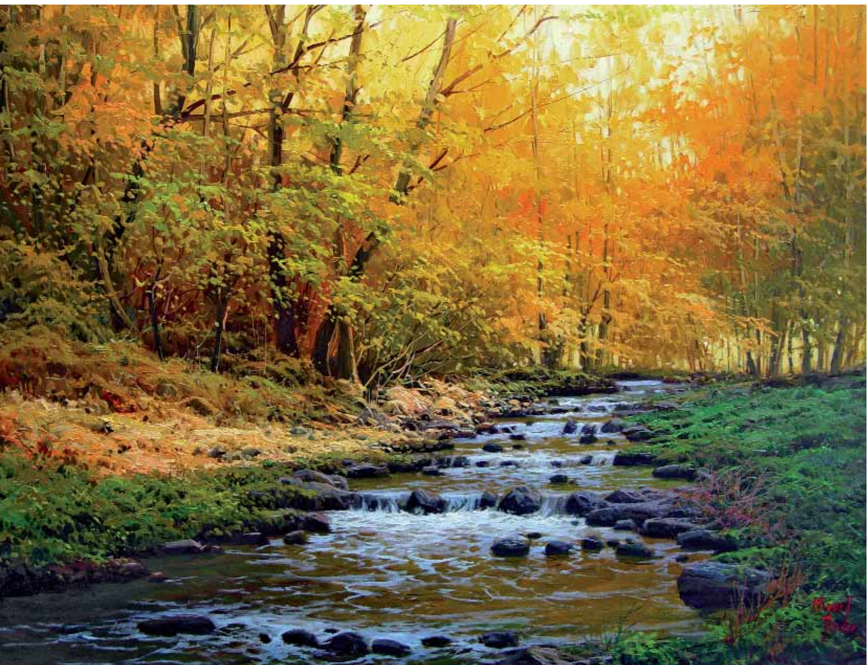
Río Saja Óleo s/lienzo — 81x65 cm