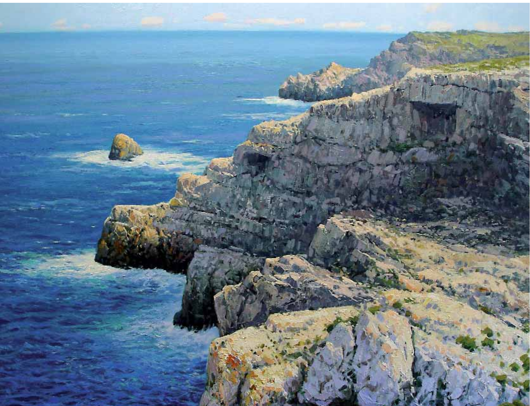
Cala de Menorca