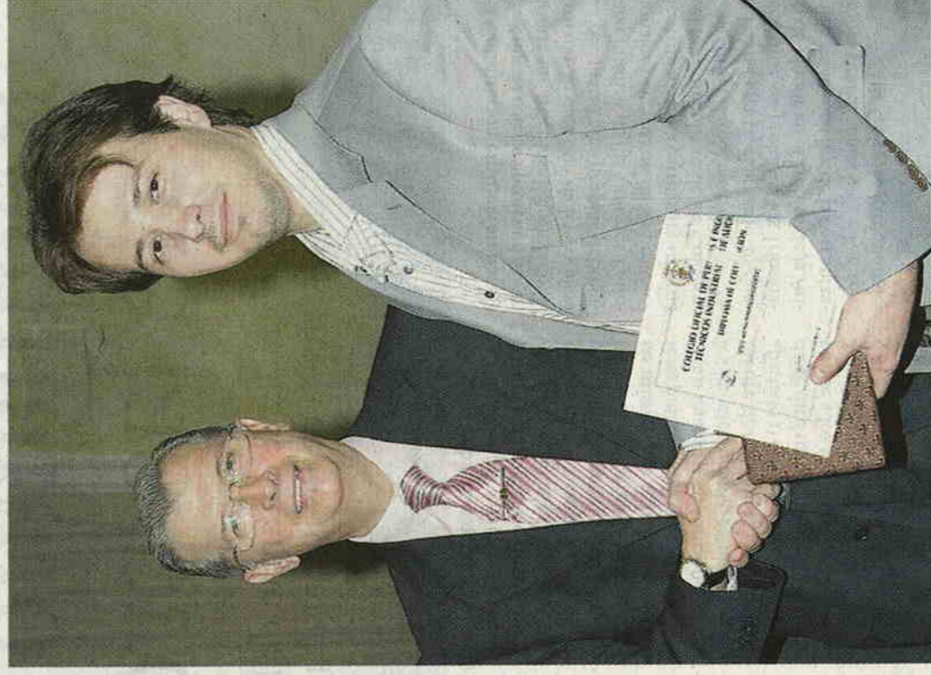
Entrega del diploma que acredita a un nuevo colegiado.